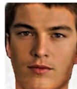
So könnte Felix heute (2020) aussehen!